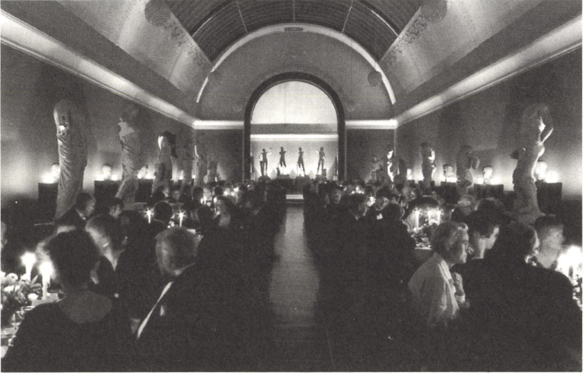
En af salene i Ny Carlsberg Glyptotek.