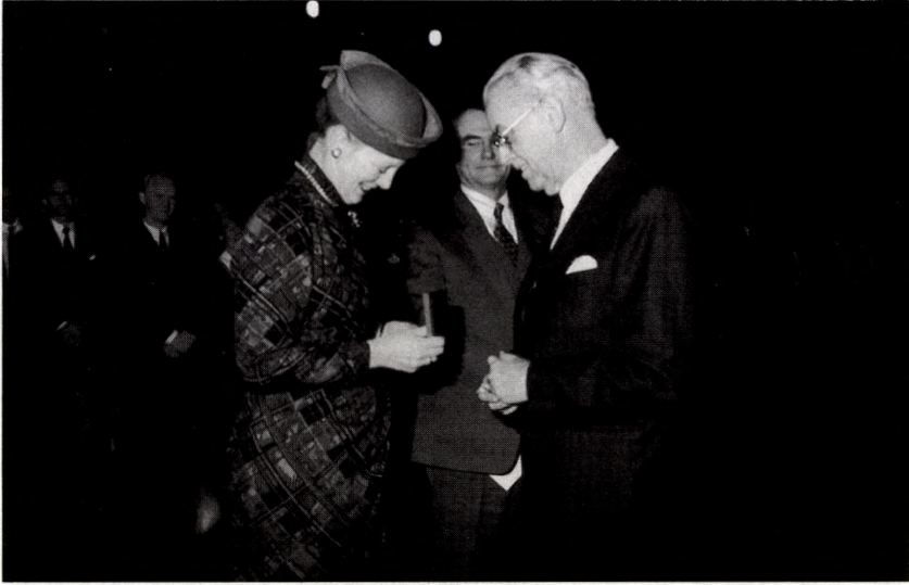
H. M. Dronning Margrethe II modtager guldmedaillen af Selskabets præsident; imellem dem H. K. H. Prins Henrik.