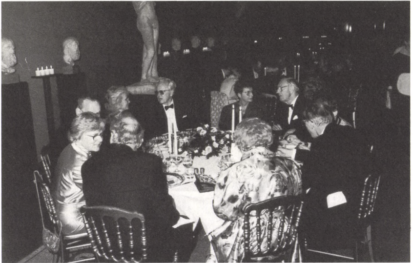
Et af bordene ved festen på Ny Carlsberg Glyptotek.