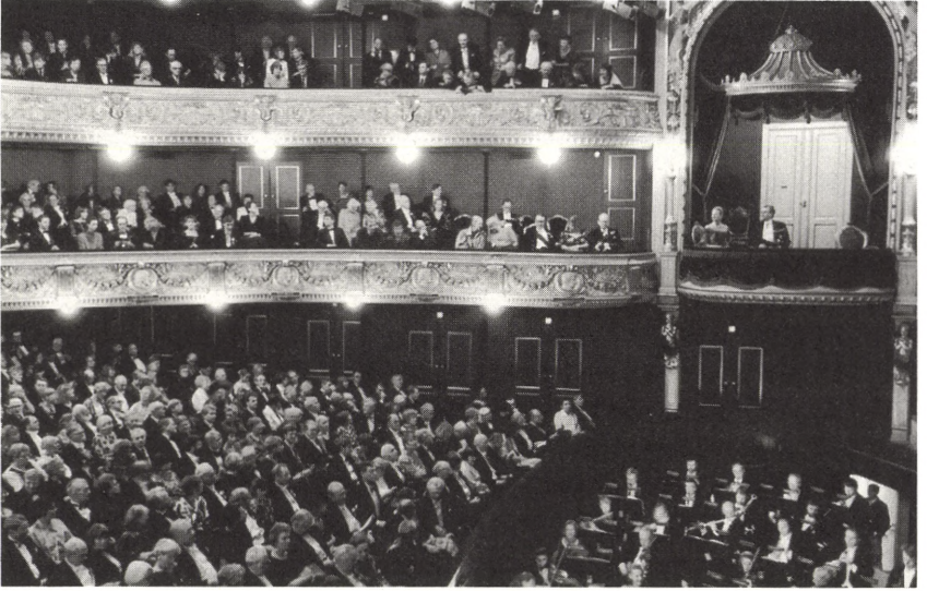
Det Kongelige Teater.